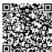
防空演習或空襲時的警報音符圖示