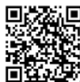
防空演習結束或空襲解除時聽到的解除警報聲音