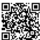
防空演習或空襲時聽到的緊急警報聲音