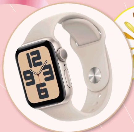
Applewatch SE 40mm