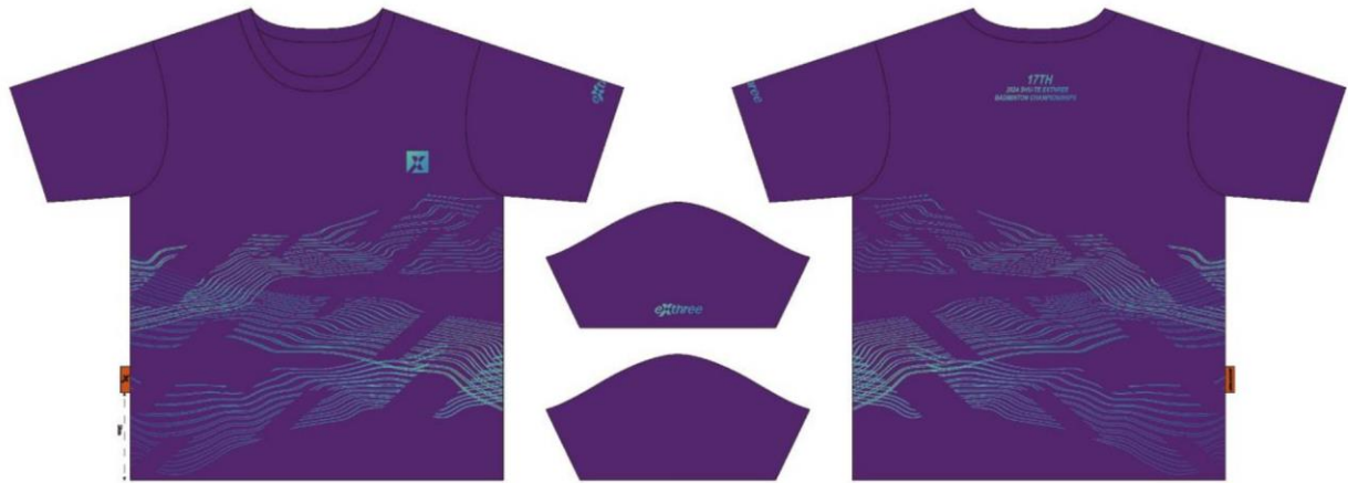
熱昇華 T-Shirt 尺寸表