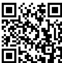
線上報名 QR code

線上報名連結 https://forms.gle/VK85tC8FitYJraGh7