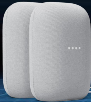
Google Nest Audio 智慧音箱