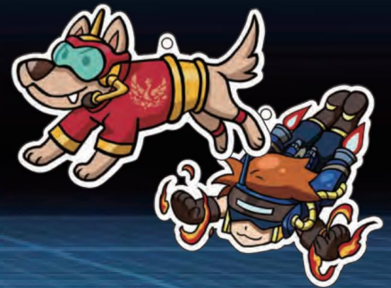
防災特攻造型一卡通 ($100)